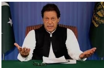
Imran Khan talar till folket.

Många politiker vill förstås begränsa NAB:s mandat. Vid parlamentsvalet den 25 juli 2018 fick flera korruperade politiska tungviktare ej delta.