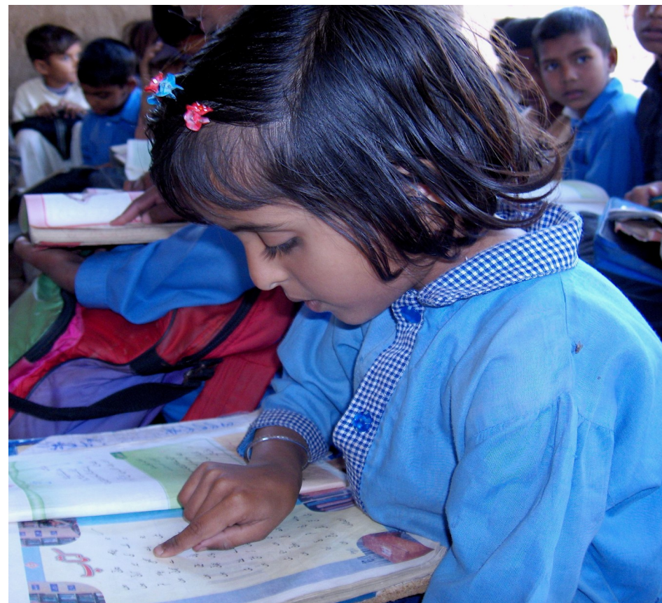
Bild: Elev i årskurs 1 i en PACS-skola

----- PAN ASIA COOPERATION SOCIETY Haga Nygta 21, Göteborg, www.pacs.nu